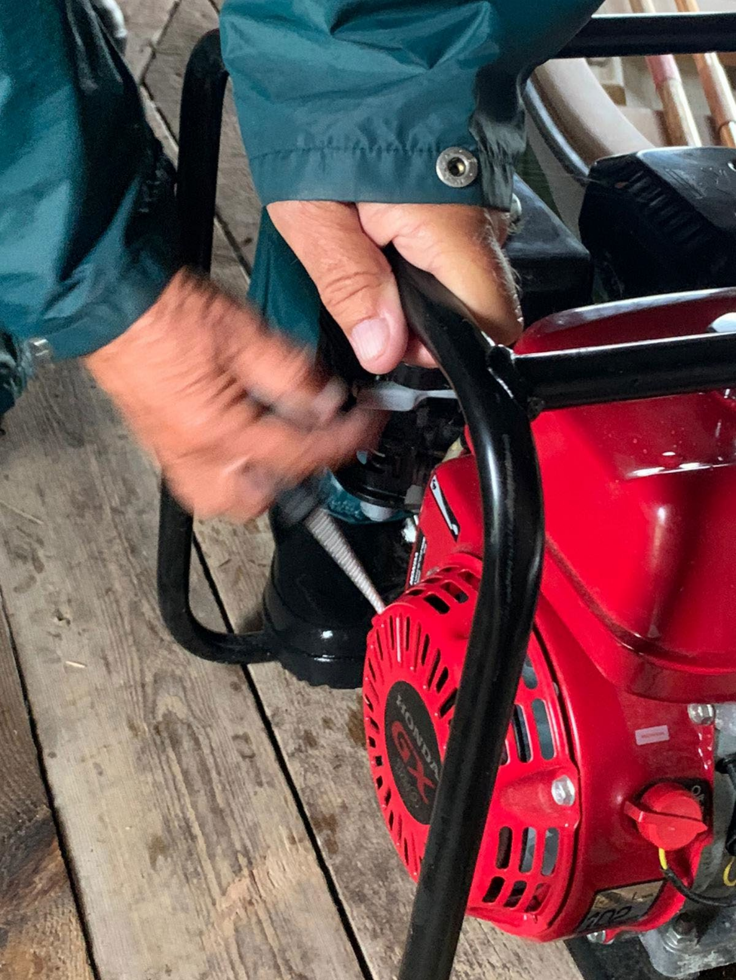
11. Starta pumpen.